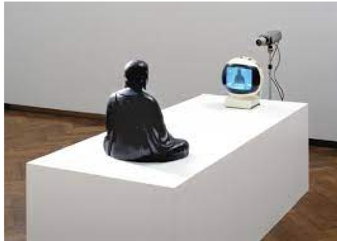
Nam June Paik 1932 - USA, 2006