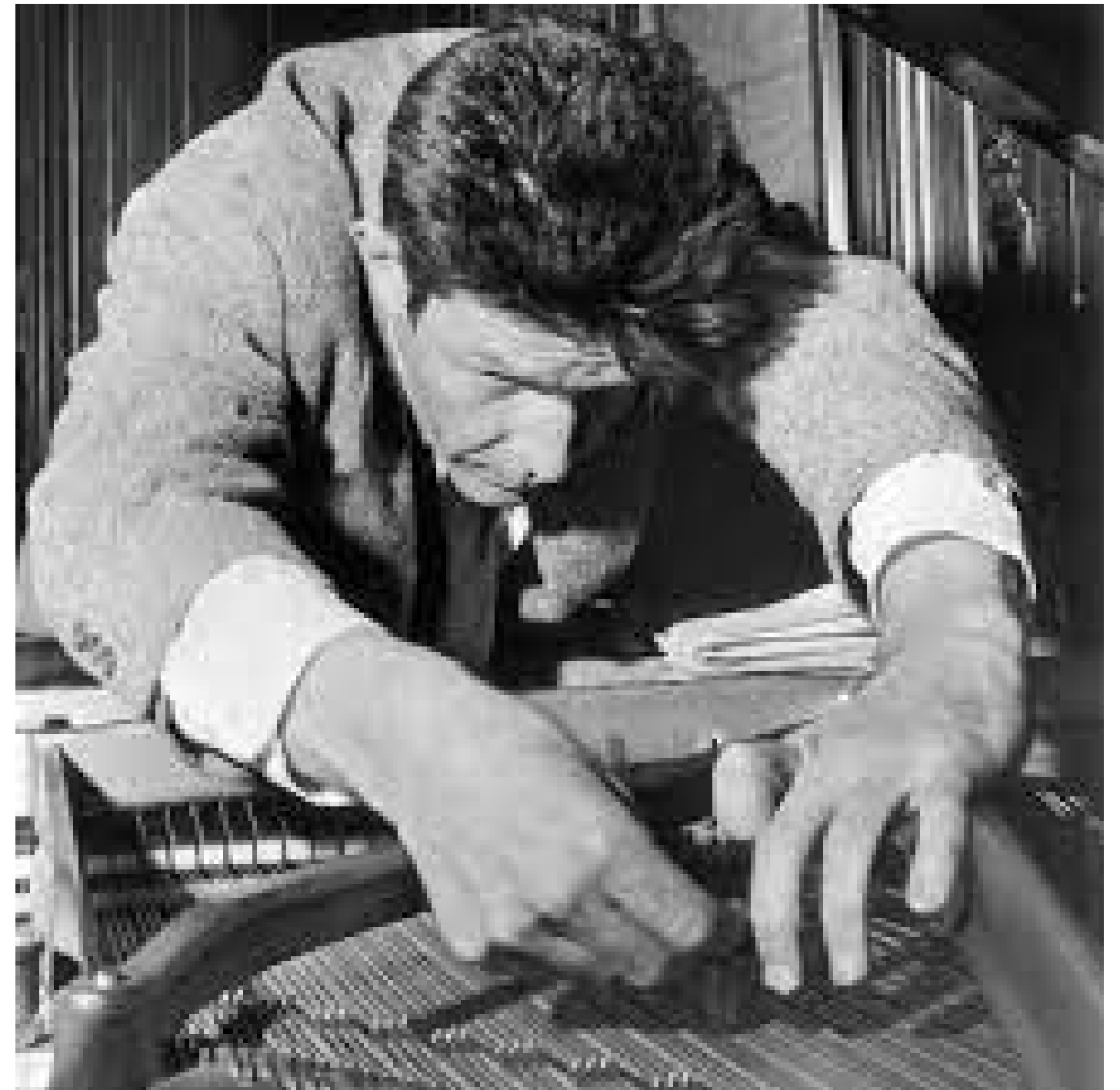
John Cage 1912 - 1992